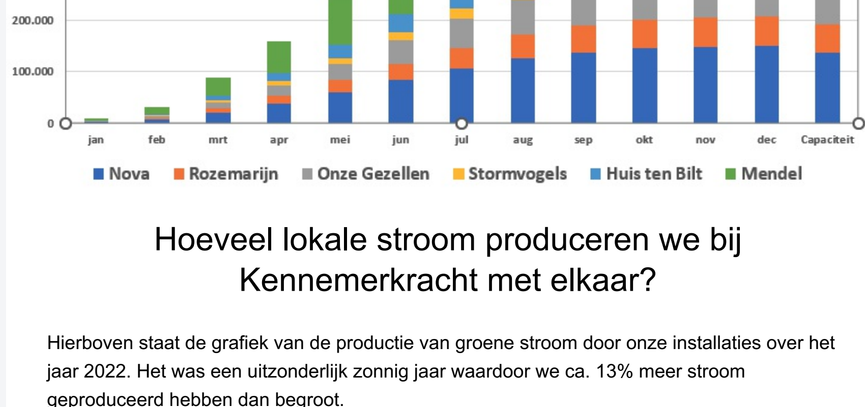
Electriciteit productie Kennemer Kracht (kWh)